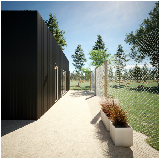
Fachada lateral y perímetro