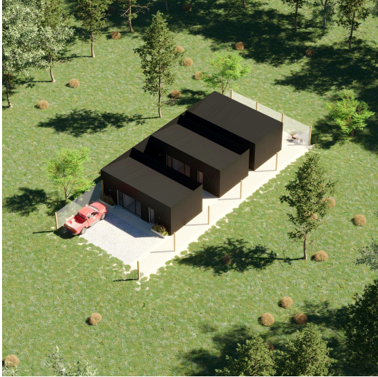
Módulo de lote con 3 UF